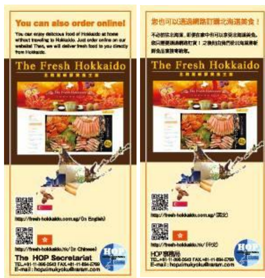
※チラシイメージ図(英語版、中国語版)