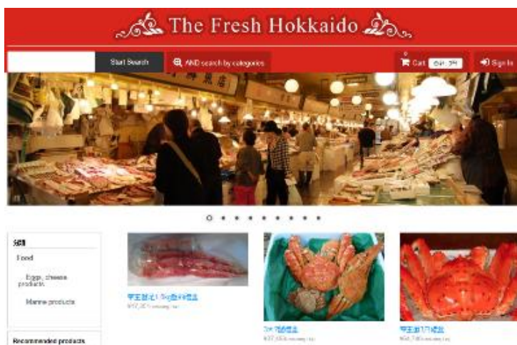
※サイトイメージ図(中国語版)