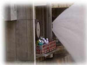
〈目前での放流見学〉