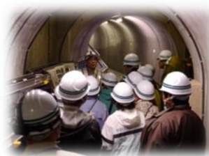
〈堤体内監査廊見学〉