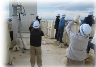
〈主塔中間部の見学〉