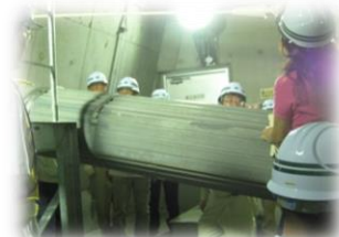
〈ケーブル施設の見学〉