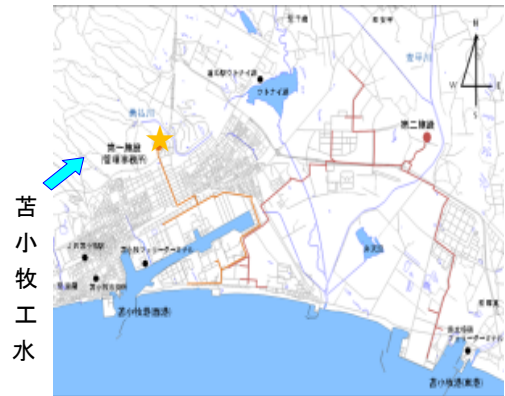
工業用水配水管ルート