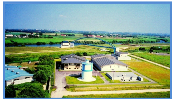
中沼浄水場全景(札幌市東区)